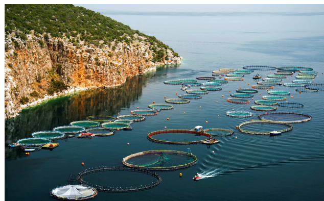
Ferme aquacole en mer Égée.

Oui, et cela s'est joué au moment de la crise ukrainienne. Face aux sanctions de l'Union européenne et des États-Unis, Moscou décrète un embargo sur leurs fournitures agricoles et alimentaires. La Russie vise ainsi un double but : fragiliser les économies américaine et européenne, tout en favorisant le développement du secteur agricole russe. Au bilan, les Européens ont perdu un marché et gagné un concurrent, tandis que les Américains ont perdu leur place de premier exportateur mondial de blé au profit des Russes. En développant ce secteur, Moscou s'est attaché à consolider sa sécurité alimentaire tout en se dotant d'instruments d'influence à l'international.